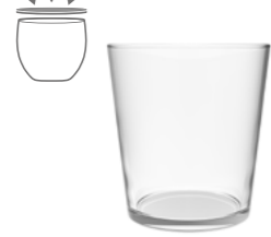
ENVASADOR 45CL V0268

15 1 / 4 oz. (US) 15 3 / 4 oz. (IMP) H 111mm · ø 88,5mm · W 230g 1.350 p.p. (EU. Pallet)