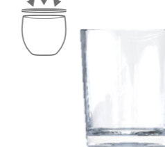
VELADORA 11CL V4251

3 1 / 2 oz. (US) 3 3 / 4 oz. (IMP) H 66mm · ø 57,5mm · W 112g 4.500 p.p. (EU. Pallet)