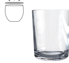
LANGUEDOC 25CL V1889

8 1 / 4 oz. (US) 8 3 / 4 oz. (IMP) H 89,5mm · ø 73,5mm · W 210g 2.558 p.p. (EU. Pallet)