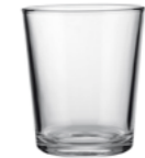
CADAGUA 18CL V4083 6 oz. (US) 6 1 / 4 oz. (IMP) H 87mm · ø 65mm · W 136g 2.904 p.p. (EU. Pallet)