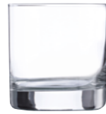
AIALA 30CL V1462 10 oz. (US) 10 1 / 2 oz. (IMP) H 92mm · ø 79mm · W 313g 1.755 p.p. (EU. Pallet)