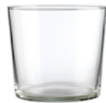
SIDRA MIDI 36CL V1478

12 oz. (US) 12 1 / 2 oz. (IMP) H 89mm · ø 85mm · W 181g 1.485 p.p. (EU. Pallet)