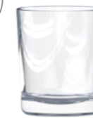
CERERO 16CL V4579 5 1 / 4 oz. (US) 5 1 / 4 oz. (IMP) H 78mm · ø 65mm · W 150g 2.958 p.p. (EU. Pallet)