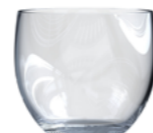
SLEEVE 25CL V1348

8 1 / 4 oz. (US) 8 3 / 4 oz. (IMP) H 70mm · ø 79,5mm · W 120g 2.310 p.p. (EU. Pallet)