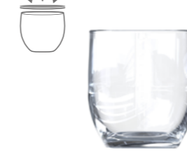
RIGA 29CL V1321

9 3 / 4 oz. (US) 10 oz. (IMP) H 95mm · ø 76mm · W 220g 2.393 p.p. (EU. Pallet)