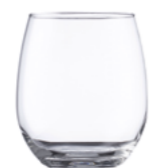
CHABLIS 35CL V1481 11 3 / 4 oz. (US) 12 1 / 4 oz. (IMP) H 99mm · ø 99mm · W 132g 1.540 p.p. (EU. Pallet)