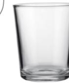
CADAGUA 28CL V1460 9 1 / 4 oz. (US) 9 3 / 4 oz. (IMP) H 89,5mm · ø 79mm · W 222g 1.755 p.p. (EU. Pallet)