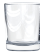
CERERO 20CL V4060 6 3 / 4 oz. (US) 7 oz. (IMP) H 85mm · ø 70,3mm · W 189g 2.304 p.p. (EU. Pallet)