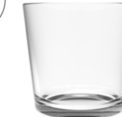
DULCINEA 25 CL V0426 8 1 / 4 oz. (US) 8 3 / 4 oz. (IMP) H 84mm · ø 74,7mm · W 197g 2.156 p.p. (EU. Pallet)