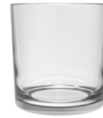
AMBIENT 20CL V1359 6 3 / 4 oz. (US) 7 oz. (IMP) H 85mm · ø 71mm · W 213g 2.232 p.p. (EU. Pallet)